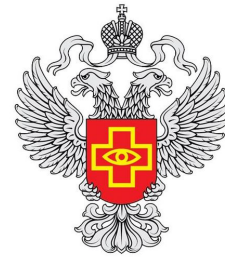
Территориальный орган Управления Федеральной службы по надзору в сфере здравоохранения по Рязанской области