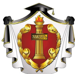
Адвокатская палата Рязанской области