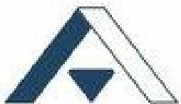
Центральное окружное отделение Арбитражного центра при РСПП