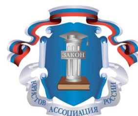
Ассоциации юристов России Рязанское региональное отделение