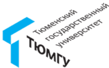
Институт государства и права ФГАОУ ВО «Тюменский государственный университет»