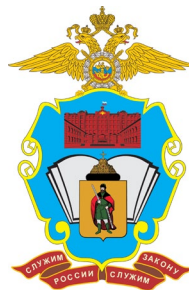
Федеральное государственное казенное образовательное учреждение высшего образования «Московский университет МВД России имени В.Я. Кикотя» (Рязанский филиал)