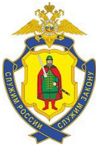
Управление МВД России по Рязанской области