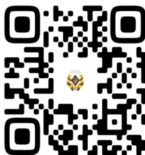
Официальная группа РязГМУ в социальной сети ВКонтакте