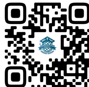
Официальная группа студенческого научного общества РязГМУ в социальной сети ВКонтакте