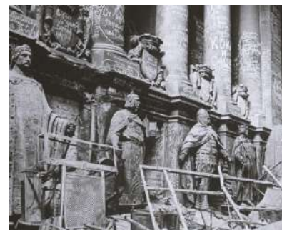
Надписи советских солдат на Рейхстаге

продолжались на вражеской территории, унося немало человеческих жертв. В госпиталь непрерывно поступали раненые. Медикам приходилось трудиться день и ночь, особенно доставалось медсестрам, которые не только помогали при операции и наркозе, переливали кровь, делали уколы, накладывали шины и гипсовые повязки, но нередко сами таскали раненых, осуществляли уход за ними – ведь от этого зависело не только самочувствие раненого, но и результативность операции. Санитаров не хватало, помогали в госпитале легкораненые бойцы... 2 мая 1945 года после тяжелых боев советские войска полностью освободили Берлин от фашистов и водрузили Знамя Победы над Рейхстагом. Все стены Рейхстага были исписаны именами и фамилиями советских солдат и офицеров, дошедших до Берлина из-под Москвы, Сибири, Дальнего